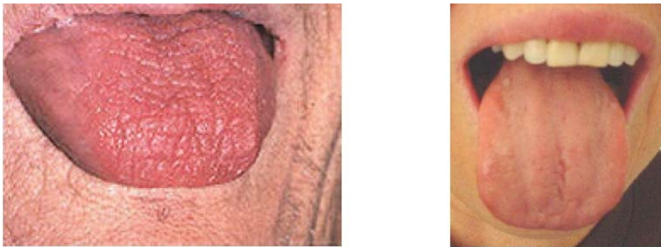
Figure 12 : Xérostomie Sévère

La xérostomie (ou sécheresse buccale) se développe lorsque la production de salive diminue. Les personnes atteintes de cette condition ont souvent d'importants problèmes d'altérations du goût et lorsqu'elles mangent, parlent et avalent. La sécheresse buccale est souvent associée à des irritations et à une douleur qui peut se transformer en syndrome de la bouche brûlante. La xérostomie entraîne également une diminution de l'action antimicrobienne de la salive, créant un environnement favorable à la prolifération d'espèces fongiques responsables d'infections.