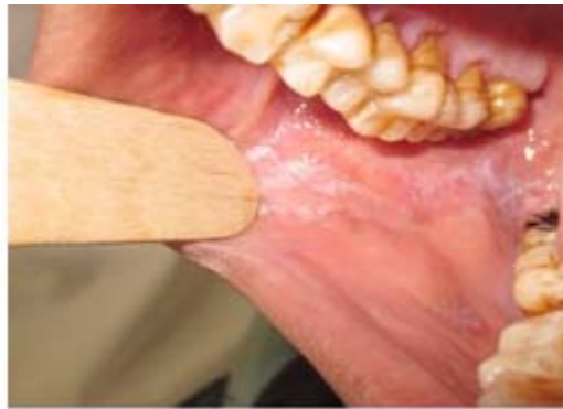
Figure 8 : Lichen plan de la face interne de la joue en forme de stries (S. Source BOUZOUBAA, I. BENYAHYA Le lichen plan buccal : mise au point Le courrier du dentiste du 09 Juillet 2013)

Le lichen plan buccal reste d'étiologie incertaine, il atteint de façon prépondérante les femmes d'âge moyen (quatrième et cinquième décennies) [32].