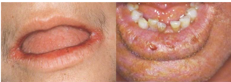
Figure 10 : Chéilite angulaire

Inflammation des lèvres caractérisée par une rougeur, des fissures et une desquamation fine. Des vésicules et œdèmes peuvent également se produire. La chéilite se retrouve fréquemment chez les patients porteurs d'un eczéma atopique. Plusieurs origines lui sont reconnues qui sont différentes chez les enfants et les adultes. Elles peuvent être spongiotiques, de nature irritative ou allergique. D'autres sont kératosiques et peuvent évoluer vers une leucoplasie et un carcinome épidermoïde.