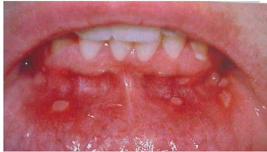
Figure 9 : Aphtes

Les aphtes peuvent également être un symptôme d'une autre maladie comme la tuberculose, la mononucléose infectieuse, certaines infections bactériennes à streptocoques, une carence en vitamine A ou en acide folique ou encore la toxoplasmose.