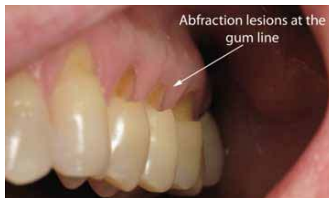
Figure 5 : Abfraction

On retrouve des lésions d'abfraction dans la région cervicale où les forces de flexion coronaire peuvent mener à des microfractures des prismes d'émail. Ces lésions ont une forme de croissant le long de la ligne cervicale. On peut les retrouver sur une dent ou sur un groupe de dents. En combinaison avec un agent abrasif ou un agent corrosif, ou les deux, la perte de tissu peut devenir hautement significative.