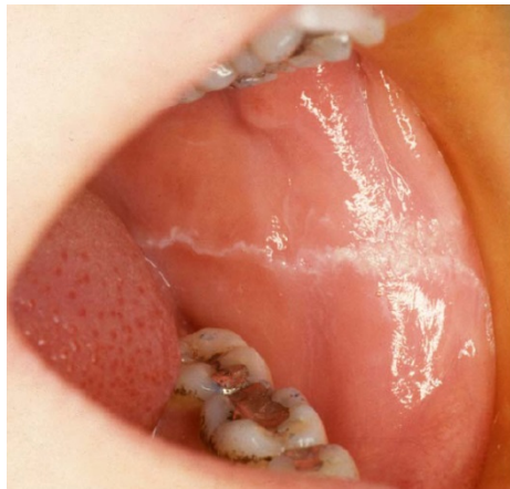
Figure 5 : Ligne blanche

Il s'agit d'une variante physiologique. Elle correspond à un relief linéaire horizontal, de couleur légèrement blanche située à mi-hauteur de la face interne des joues, en regard du plan occlusal.