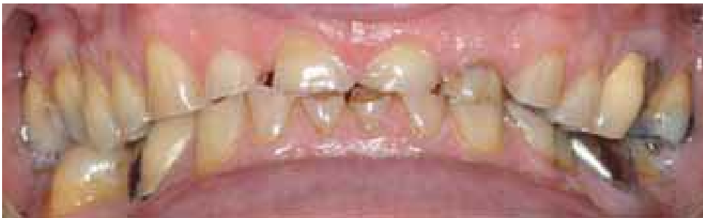
Figure 4 : Attrition dentaire

Elle affecte les faces occlusales des dents postérieures et les bords incisifs des dents antérieures. L'attrition proximale, c'est-à-dire au niveau des contacts inter-dentaires, peut provoquer un rétrécissement de l'arcade dentaire par transformation du point de contact en surface de contact large.