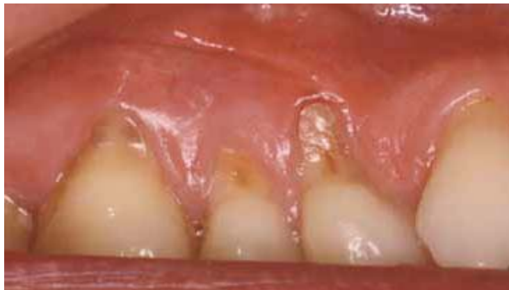
Figure 2 : Abrasion

L'origine latine du mot abrasion est 'abrasio' qui vient du verbe 'abradere'. Ce dernier signifie 'enlever en râclant'. Il s'agit donc d'un phénomène mécanique. En effet, l'abrasion résulte du frottement de deux surfaces, ou plus, en contact l'une avec l'autre et animées d'un mouvement relatif. Ce frottement provoque la disparition irréversible de l'émail avec une mise à nu de la dentine et donc l'apparition d'une sensibilité dentinaire au chaud et au froid. Cependant, lorsque l'usure est progressive et lente, elle est considérée comme un processus normal et non pathologique. Il est important de noter que l'opinion actuelle plaide en faveur d'une étiologie mixte c'est-à-dire d'une attaque chimique qui favorise l'élimination mécanique de l'émail fragilisé par les acides. En effet, ce processus est inévitablement combiné à de l'attrition et/ou à de l'érosion. De plus, les acides renforcent les effets de l'attrition et de l'abrasion, et inversement. Il s'agit donc d'une triade érosion, abrasion, attrition.