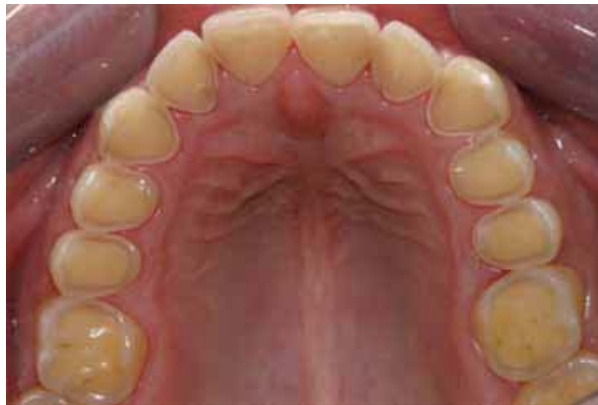
Figure 3 : Erosion palatine

L'érosion est la dissolution des tissus dentaires durs par des acides sans implication de micro-organismes. Elle peut être causée par des facteurs intrinsèques, comme dans le cas des troubles gastro-intestinaux, et des facteurs extrinsèques qui incluent par exemple la consommation de boissons acides. Les lésions érosives sont lisses, brillantes et larges mais avec une bordure d'émail intacte. Elles sont localisées, le plus souvent, sur les faces occlusales, sous formes de cuspidés arrondies ou de concavités dans les stades plus avancés, et sur les faces palatines des incisives supérieures.