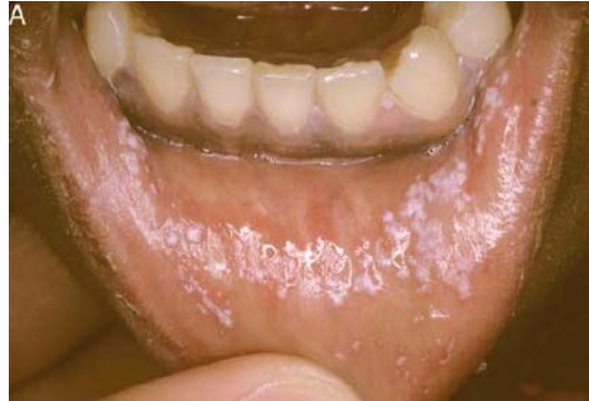
Figure 7 : Stomatite candidosique

Candida albicans est un hôte saprophyte habituel de la cavité buccale. Un enfant sur trois en est porteur sain. Certains facteurs locaux, généraux (hémopathie, déficit immunitaire) ou iatrogéniques (antibiothérapie, corticothérapie locale ou générale, traitement immunosuppresseur) peuvent conduire de l'état saprophyte à l'état pathogène. Le siège est le plus souvent la langue et la face interne des joues gênant parfois l'alimentation.