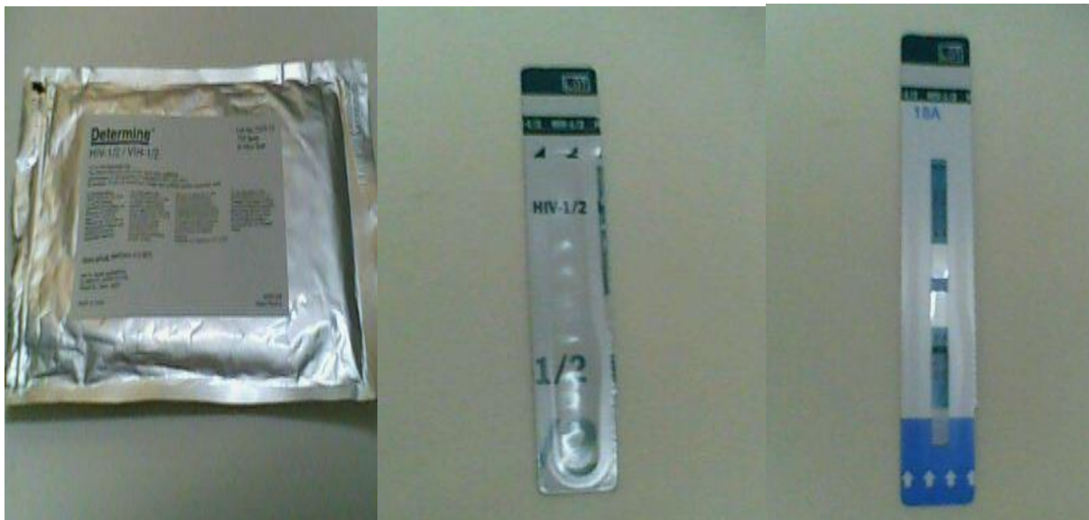
Figure 2: Kit du test Abbott Determine Ag HBs.

La recherche de l'AgHBs a été faite par le test Abbott Détermine™ AgHBs Lot.N° : 48012K100. Abbott Détermine™ AgHBs est un test immunologique qualitatif in vitro à lecture visuelle pour la détection des AgHBs dans le sérum, le plasma ou le sang total humain. Ce test constitue une aide pour la détection des AgHBs chez les sujets infectés.