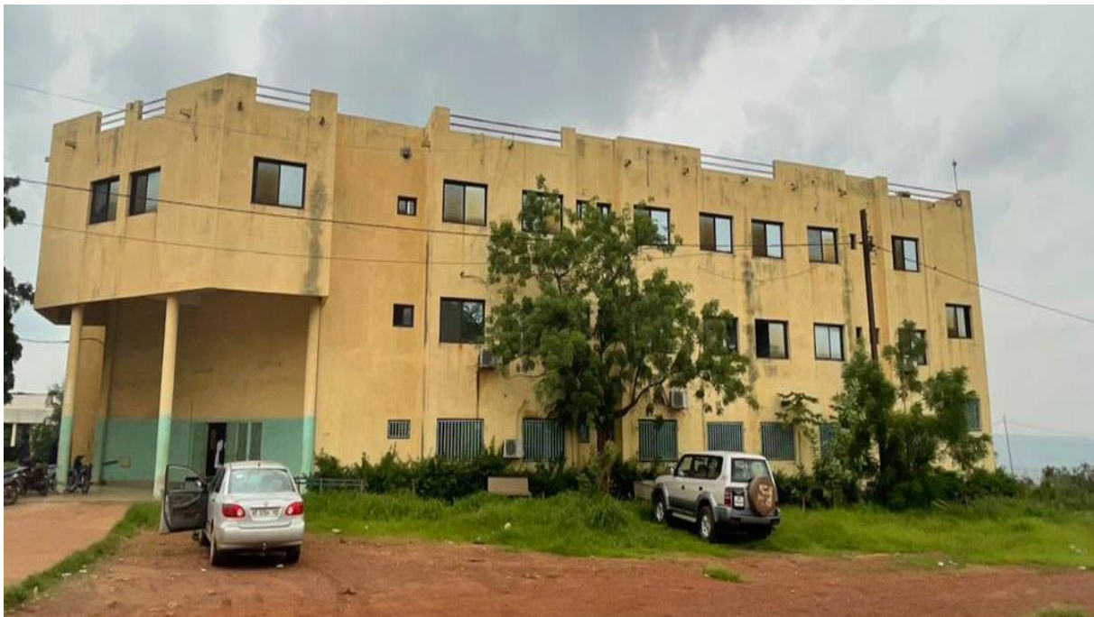
Figure 02 : Vue d'ensemble de face convexe - Médecine Interne côté Sud au bord de la route

Érigé en 2 étages couleur jaune d'or (synonyme de richesse) et par endroit de couleur verte sur 685m 2 x3 de surface avec assez de commodités requises et investit le 2 février 2013 après 2 à 3 ans de fin des travaux de construction pour problème d'équipements, ce service en forme de cuve (convexe en avant et concave en arrière) est limité au Nord par le central d'épuration des eaux usées du CHU, au Sud par la route bitumée le séparant des services de pneumologie et de cardiologie B et menant à la psychiatrie à l'Est, à l'Ouest par le service des Maladies Infectieuses et le centre de l'association des PVVIH.