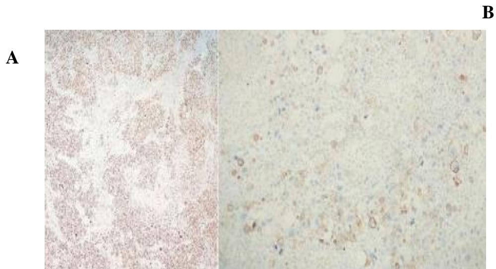
Figure 2: Immunohistochimie : marquage positif des cellules tumorales par la CK5/6 (A) ; marquage nucléaire de plus de 85% des cellules tumorales par le Ki 67 (B)